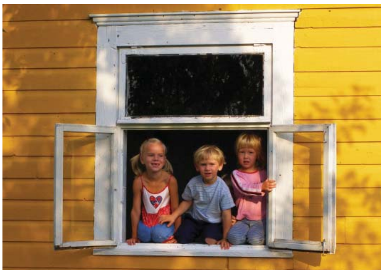
Hi ha una relació inversament proporcional entre la despesa social d'un país i la seva taxa de pobresa infantil. Mentre que als països nòrdics, paradigma de l'Estat de Benestar a Europa, la despesa social en família i fills s'enfila en alguns casos al 3 per cent del PIB, a Espanya tot just supera l'1 per cent

Per a Flaquer, l'elevada incidència de la pobresa infantil «es deu en part a l'es-